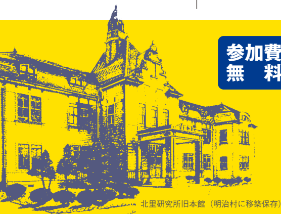
北里研究所旧本館(明治村に移築保存)