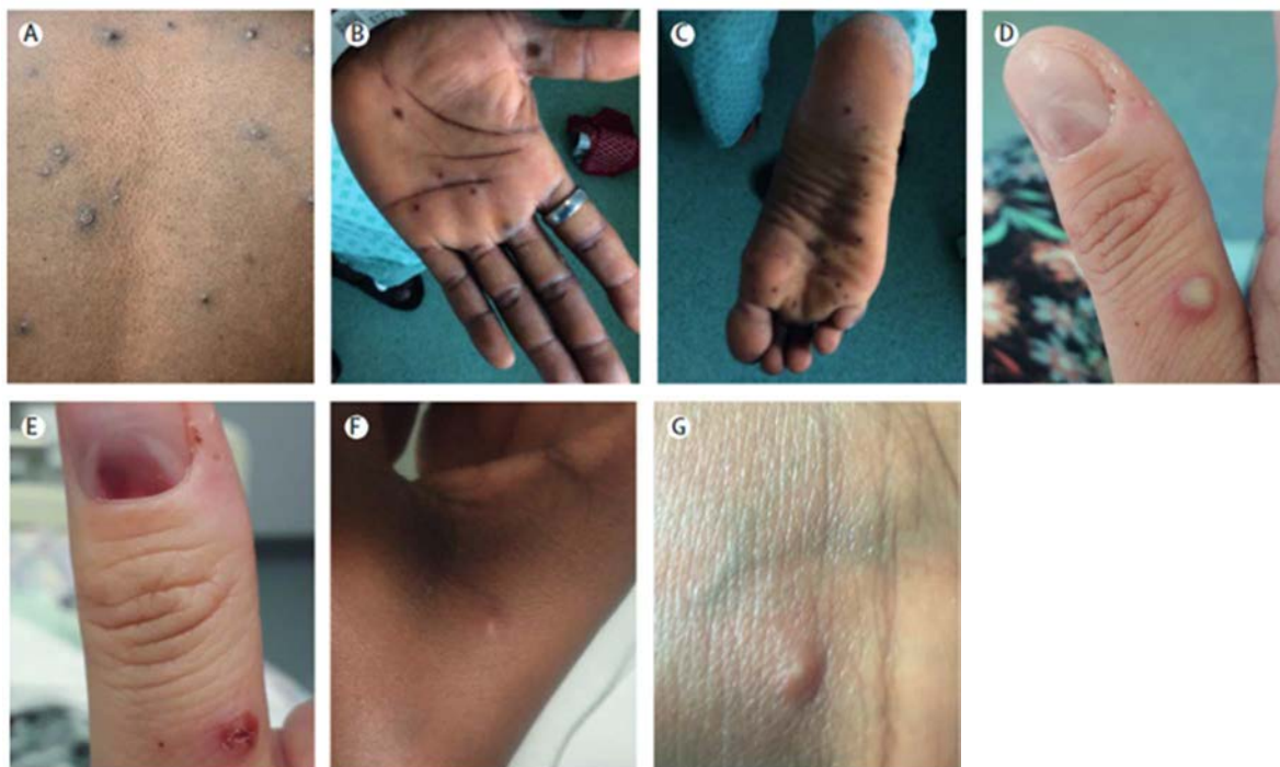
A : 小水疱、B, C : 手掌、足底の斑点状の皮疹、D : 膿疱と爪下病変、E : 爪下病変、F, G : 小丘疹、小水疱 (文献 1)

顔面 (95%)、手掌、足底 (75%) に好発する。発疹の経過は 10 日程度で、斑点状→小水疱→膿疱→痂皮と経過をたどる。発疹が多く発生する部位として、多い順に、顔 > 脚 > 体幹 > 腕 > 手掌 > 生殖器 > 足底が挙げられる 1 。口腔粘膜や結膜、角膜にも発症した例が報告されている。痂皮は 3 週間は完全に消失しないことがあり、結痂 (けつか) が乾燥して痂皮になり、剥がれ落ちると感染力はなくなる 2 。