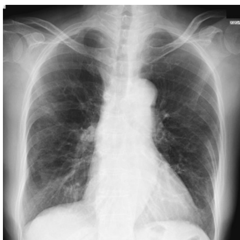
Fig. 1 Chest X-ray at the time of admission to the previous hospital

病日に採取した鼻腔・咽頭それぞれからのぬぐい液を用いたRT-PCR法ではSARS-CoV-2遺伝子は検出されなかった。第9病日の胸部CTでは両側末梢に広がっていたスリガラス陰影、浸潤影は縮小し、収縮性変化を呈していた (Fig. 2)。第10病日に退院となった。